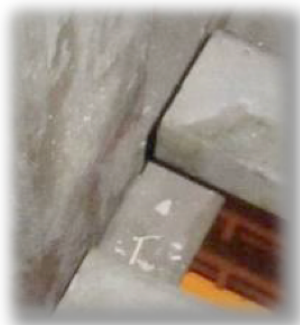
Sobre la pasarela perimetral de iluminación.

Tras tener conocimiento de la posible presencia de amianto en el Estudio 11, esta Sección Sindical inició las actuaciones que exige el protocolo de Salud Laboral instando a CRTVE a que realizara de forma urgente los análisis de los residuos que parecían ser amianto.