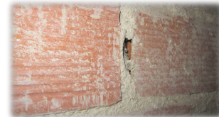
Sobre pared de ladrillo, por encima de la pasarela perimetral del estudio.

Las manchas blanquecinas sobre los ladrillos, pasarela de iluminación, tubos coarrugados, canalización de aire, perfiles, cuadros eléctricos,... son amianto