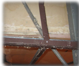
Sobre perfilera de antiguo falso techo de virutex.